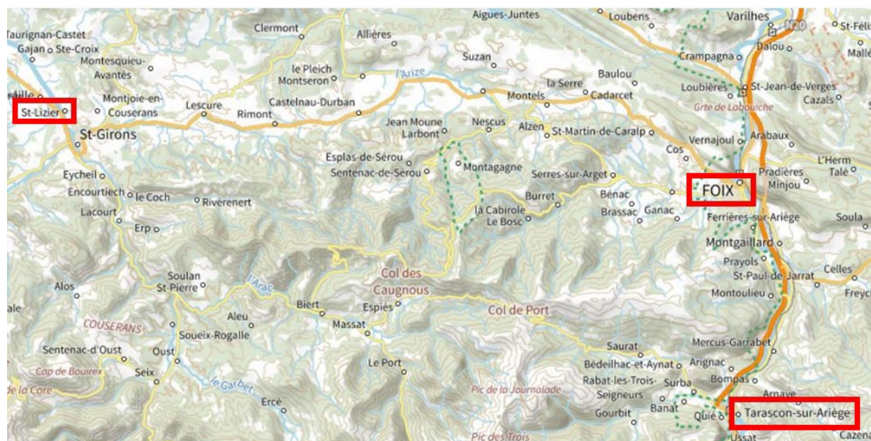
Carte de situation des différents lieux du programme